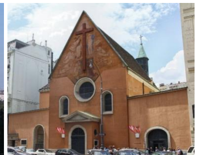
A schönbrunni kastély, ahol Ferenc császár és magyar király meghalt. A bécsi kapucinus kolostor, ahol eltemették I. Ferencet