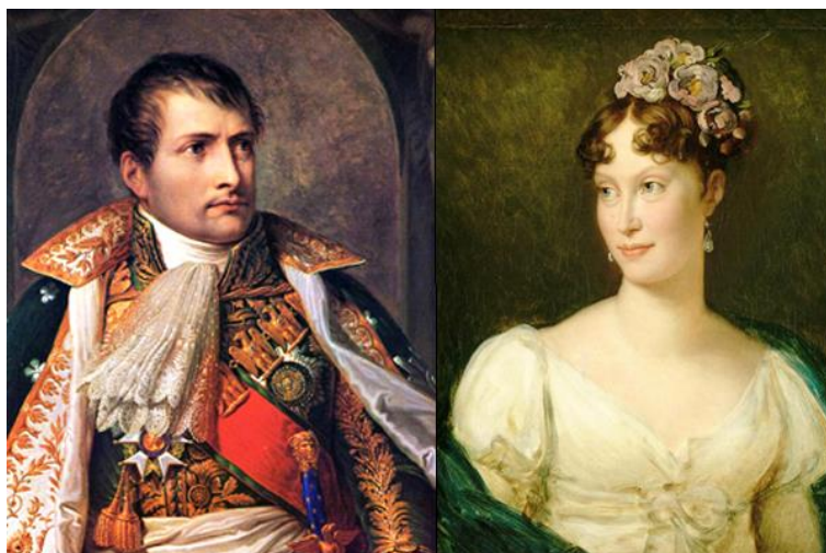
Győri csata helyszínét jelölő szobor, amit 1897-ben állítottak fel. Napóleon és felesége, Habsburg Mária Lujza főhercegnő