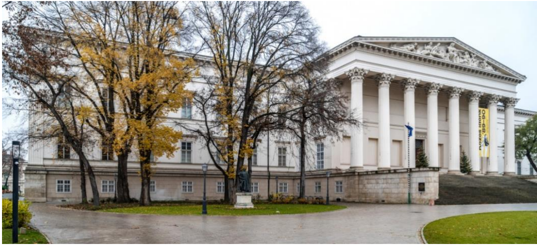
A Magyar Nemzeti Múzeum épülete, ami talán a legjobban fejezi ki a reformkor nagyjainak máig meghatározó alakját, tevékenységét

Az a korszak, ami I. Ferenc ellentmondásos uralkodásának időszakát öleli fel, az a magyar reformkor kezdte. A fenti névsor, a téma kimeríthetetlen gazdagsága megkívánja, hogy ezt dicsőséges időszakot a következő fejezetben tárgyaljuk. Elgondolkodhatunk azon, hogy milyen mértékben járult hozzá ehhez a számunkra fényes korszakot jelentő évtizedekhez a francia terror, a merev, diktatórikus Habsburg uralom, s amiről még nem esett szó, a Kárpát-medence népeinek éledezése. Erre egy közmondásunk adhat találó választ, Súly alatt nő a pálma!