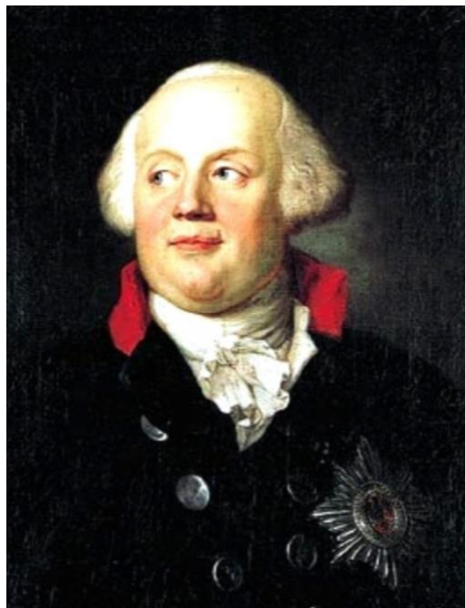
Ferenc császár uralkodói díszben. (Amerling festménye) II. Frigyes Vilmos (1786-1797) porosz király