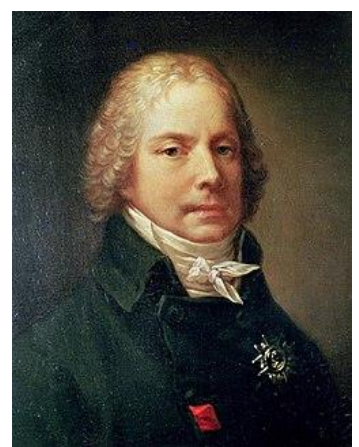
Husz János máglyahalála, Luther Márton, Talleyrand

Visszakanyarodva a franciaországi eseményekhez, már 1791-ben kivégeztek 1400 rabot, közöttük mintegy 300 katolikus papot. Majd kiutasítottak az országból 30.000 egyházi vezetőt, akik nem voltak hajlandók megtagadni Rómát, akik nem voltak hajlandók letenni a hűségüket a „forradalmi állam” alkotmányára. A francia menekültek közül sokan Magyarországon találtak menedéket.