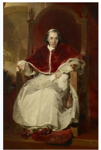
Napóleon császárrá koronázása Párizsban (David festménye) VII. Piusz pápa a Vatikánban (Thomas Lawrence festménye)

Napóleon császár serege 1808-ban elfoglalta Rómát, benne az Angyalvárat. Ezzel a hódítással a Pápai Állam gyakorlatilag Franciaország része lett. VII. Piusz pápa a franciák fogságába esett. (Meg kell említeni, hogy a pápát magyar huszárok szabadították ki Napóleon katonáinak fogságából és hazakísérték Rómába.) Napóleonnak az a terve, hogy a Vatikánt Párizsban építse fel és ott tartsa a pápát, végül nem valósult meg.