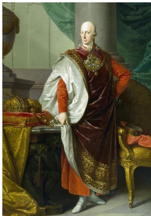
Ferenc király szobra Pannonhalmán, a Bencés Főapátságban. I. Ferenc osztrák császár portréja (Joseph Kreutzinger műve, 1806)

A reformszellemet Magyarországon azonban már nem lehetett visszaszorítani. Bécs politikája nem csak a francia felvilágosodás következményei ellen nyilvánult meg, hanem sárba tiporta a nemzeti törekvéseinket is. Kazinczy Ferenc hatéves kufsteini fogsága arra utal, hogy Bécs a magyar nyelv, a magyar nemzeti érdekek hirdetőjét büntette. Jól jellemzi a magyar nemesség és értelmiség viselkedését, hogy amikor Kazinczy 1801-ben kiszabadult fogságából, szerény zempléni birtoka nemzeti zarándokhely lett, ahova a legkiválóbb politikusok, írók, költők látogattak el, hogy találkozhassanak a nyelvújítóval, a magyar irodalom és a társadalmi viszonyok alakításának irányítójával.