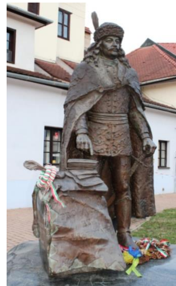
Rákóczi rodostói házának mását Kassán építették fel. A fejedelem egész alakos szobra 2006-ban került a múzeum elé

Kis idő elteltével Rodostóba költözött Bercsényi Miklós , továbbá felesége Csáky Krisztina , Forgách Simon , Esterházy Antal , Csáky Mihály , Sibrik Miklós , Zay Zsigmond és még néhány társuk. Találó lehet a főúri társakra Mikes Kelemen azon mondása, mely szerint: „ énnekem semmi okom nem volt hazámból kibujdosni, csak az, hogy nagyon szerettem a fejedelmet. ” A fejedelem mellé költöző Bercsényi találó anagrammával jellemezte Rodostót, amikor Ostorod -ra keresztelte. Rodostó örmények lakta városnegyedében a magyar bujdosók egyszerű, hétköznapi életre rendezkedtek be, amire a fejedelem életvitele meghatározó lehetett. Idézzük ismét Mikes Kelemen leírását: „ Reggel hatodfél órakor a dobot megütik, akkor a cselédeknek fel kell kelni, s készen lenni hat órára. Hat órakor dobolnak és akkor a fejedelem felöltözik. Azután kávét iszunk és dohányzunk. Amikor az óra háromfertály nyolcra ér, akkor elsőt dobolnak misére, nyolckor a másodikat, és kis idő múlva harmadikat dobolnak. Ekkor a fejedelem misére megyen, mise után