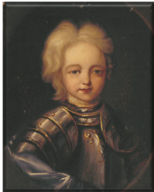
Rákóczi Ferenc fiai. Rákóczi József (1700-1738) és Rákóczi György (1701-1756)

Még az öccsénél is sivárabb, eseménytelen életet élt József. Bécsben a léha, ősei múltját elfeledő életmódra nevelték. Szicíliában kapott birtokot, hogy minél távolabb legyen családjától, szülőföldjétől. Rákóczi József apja után felvette a „munkácsi herceg” címet. Egy évvel később a szultán Törökországba hívta, hogy Erdély trónjára ültesse. Ezt sem ő, sem később bátyja sem fogadta el. József 1736-ban – apja halála után egy évvel – Rodostóba érkezett. A Porta katonai segítséget nyújtott Rákóczi fiának, aki egy kis létszámú haderő élén eljutott Erdély határáig. Ősei földjére azonban már nem tudott bejutni. A katonai akcióban részt vett Mikes