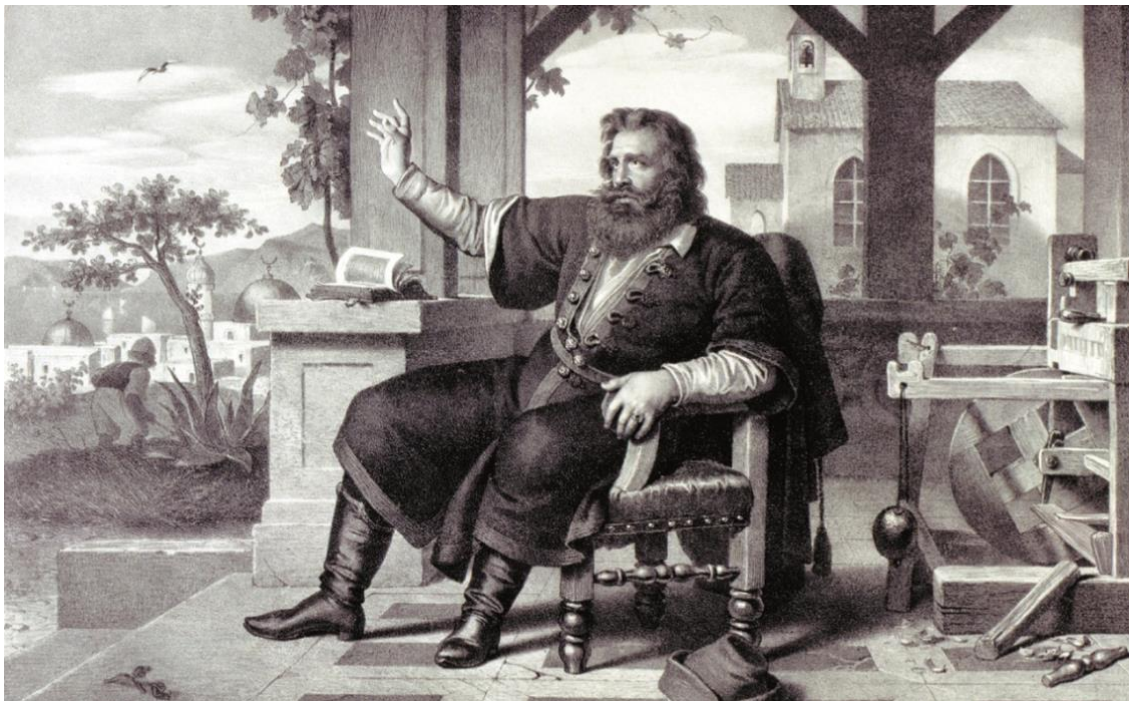
Rákóczi Rodostóban (Grimm Dezső litográfiája)

Húsz évvel a szabadságharc bukása után még mindig élt a remény a rodostói bujdosók élő tagjaiban, hogy a Habsburg-igát le lehet rázni. 1733-ban a lengyel király ( II. Ágost ) halála után egy újabb örökösödési háború volt kibontakozóban. Az európai uralkodók számítottak Rákóczi színre lépésére is, de aztán a politikai boszorkánykonyhában minden hamvába holt. Ráadásul a fejedelmet ismét elárulták, hozzá méltatlan emberek vették körül. Csak nehezen sikerült tisztázniá ártatlanságát. Mind ez a személyes csalódás, mind Magyarországnak kilátástalan helyzete, mind a honvágy kínzó fájdalma megviselték az ötvenkilencedik évében járó fejedelmet.