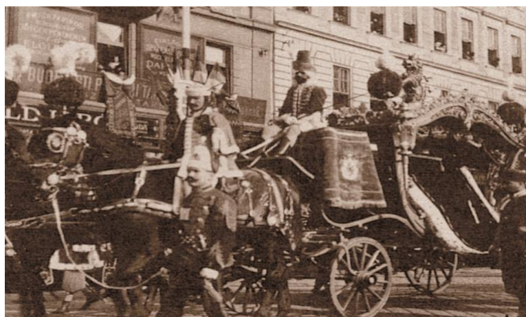
A Rákóczi hamvait szállító hintó a budapesti utcákon