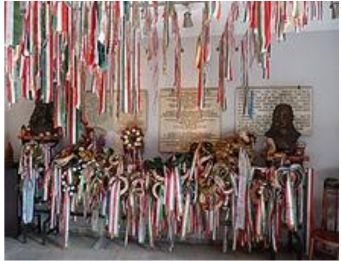
Rákóczi és a magyar emigráció ebédlőháza Rodostóban. A rodostói ház ma múzeum, amit a magyarok sűrűn felkeresnek és koszorúznak