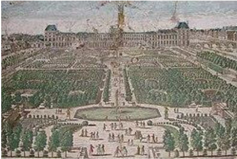
A Tulieriák kertje Párizsban, amilyenek már Rákóczi is láthatta a 18. század elején

A magyar fejedelmet a párizsi udvarban sokan kedvelték. Annak ellenére, hogy a franciák politikai céljának nem kedvezett a volt szövetséges jelenléte. A mindenkivel kritikus Saint-Simon például ezt írta róla: „ Bölcs, szerény, mértéktartó ... jóságos és értelmes, nagyon udvarias, de eléggé megválogatja kivel áll szóba. ... sok benne a méltóság, anélkül, hogy modorában bármi is éreztethetné a dicsőséget. ... Rendkívül tisztességes, egyenes, igaz, s a végsőkig bátor ember. ” Az utrechti béke megkötése után Rákóczi személyesen találkozott XIV. Lajossal, de a megbeszélésük nem vezetett eredményre. A Napkirály sem vállalta az ellentétet Béccsel, tekintettel arra, hogy a francia-osztrák béketárgyalások így is csak akadozva haladtak. Jellemző, hogy a békekötés szövegében a kurucok szabadságharcát, továbbá Rákóczi nevét meg sem említették. Az eddig még csordogáló pénzforrások is elapadtak, Rákóczi is csak egy kisebb összegű évjáradékhoz jutott hozzá. A Lengyelországban maradt magyar menekültek még nyomorúságosabb helyzetbe kerültek, élükön Vay Ádámmal. Közben, 1714-ben Szepes vármegyében a nyomor, a fokozódó elnyomás miatt felkelés bontakozott ki, amelyet a császáriak vérbe fojtottak. Vezetőiket kivégezték, Czelder Orbánt pedig középkori módon felnégyelték. (Úgy látszik, a Habsburgok nem tanultak a még csak 27 évvel korábban történt eperjesi vérfürdőt követő nemzetközi felháborodásból.)