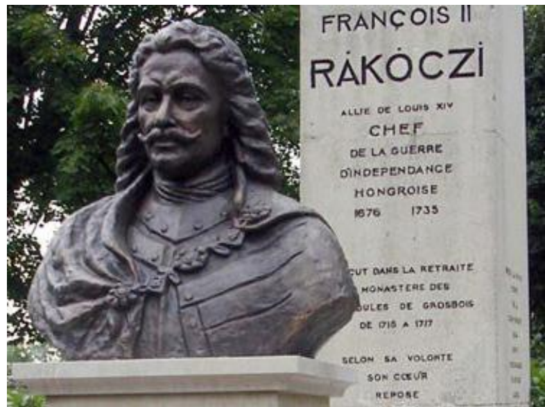
A Szent Benedek-templom oltárképe Isztambulban. Rákóczi Ferenc 2010-ben felavatott mellszobra Yerres-ben (Grosbois)

Holttestét a hű bujdosótársa, Mikes Kelemen a Porta engedélyével 1735. július 6-án Isztambulba vitte és az ottani jezsuiták a birtokukban levő Szent Benedek-templomban helyezték el. Teljesült Rákóczi végakarata, amikor édesanyja, Zrínyi Ilona mellett aludhatta örök álmát. Szívét Franciaországban, Yerres-ben a kamalduliak templomában – a Grosbois-i évek emlékére – helyezték el. (A fejedelem szívét tartalmazó szelence az 1789-es templomromboló francia forradalom idején eltűnt.) A francia kisváros lakói és vezetői azonban a mai napig